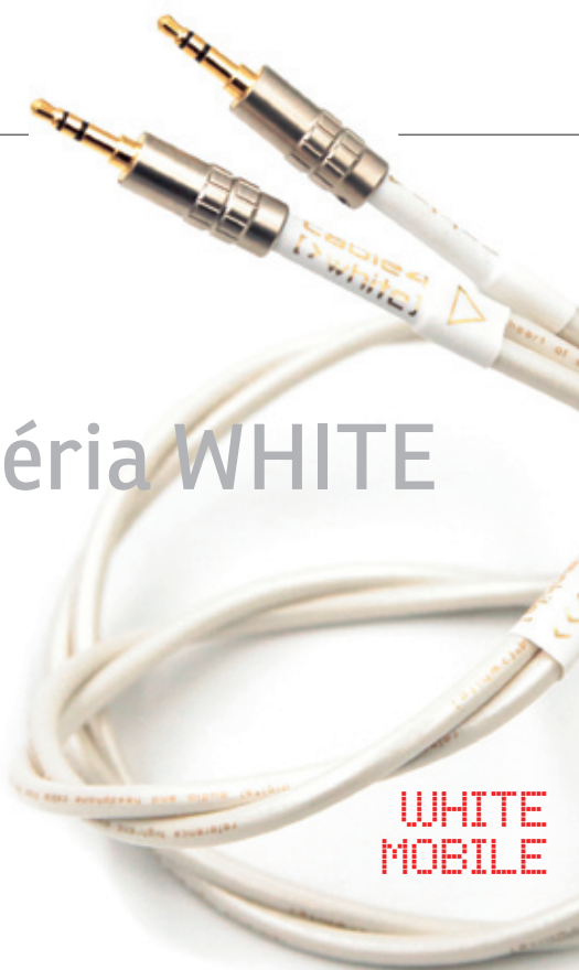
AUTOR RR FOTO CABLE 4

Cenovo sa séria zaraďuje medzi nižšiu sériu Black a druhú najvyššiu SuperBlack. Charakterom je však oveľa bližšie najvyššej sérii Reference, pri ktorej sa takisto využíva OCC meď vo vodičoch, ale s jednoduchšou geometriou usporiadania vodičov v samostatných skrútených dvojlinkách a trojlinkách, podobne ako je to pri nižšej sérii Black. Rozdiel je teda v menšej komplexnosti a dimenzii vodičov a v lacnejších konektoroch, ako má referenčná séria. Má však také isté viacvrstvé tienenie i perleťovo biele vizuálne spracovanie podčiarknuté metalickým efektom a zlatým popisom káblov. So sériou SuperBlack ju zasa spája prevažné využitie demagnetizujúcej DM-PETM izolácie pre dokonalú fázovú stabilitu aj technológiu ImpedanceControlTM pre vyrovnanú impedanciu vodičov aj pri ohyboch kábla.